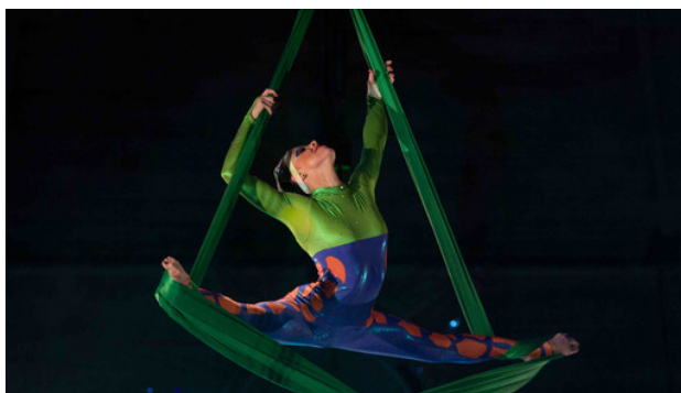
(A Menton, in Francia, ndr)