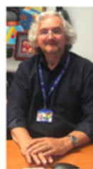
Regista Antonio Giarola

mondo dello spettacolo e del circo, ha deciso di puntare su ironia, bravura, leggerezza, avvalendosi di uno staff di alto livello creato dopo una severa selezione a inizio stagione. «Lavoro con circa 50 artisti, tra ballerini, acrobati, giocolieri». Artisti camaleontici e divertenti: trascorrendo con loro alcune ore, si può vedere vestiti da pirati alla «Nave dei Corsari», in uno show di dieci minuti che coglie di sorpresa i visitatori, e poco dopo alla rapina in banca ambientata nel Far West, nel «Villaggio West», tra spa-