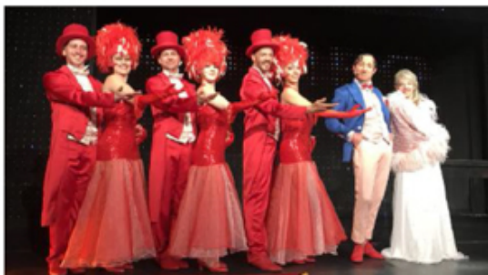
Un momento dello spettacolo che si tiene nel parco divertimenti di Gardaland