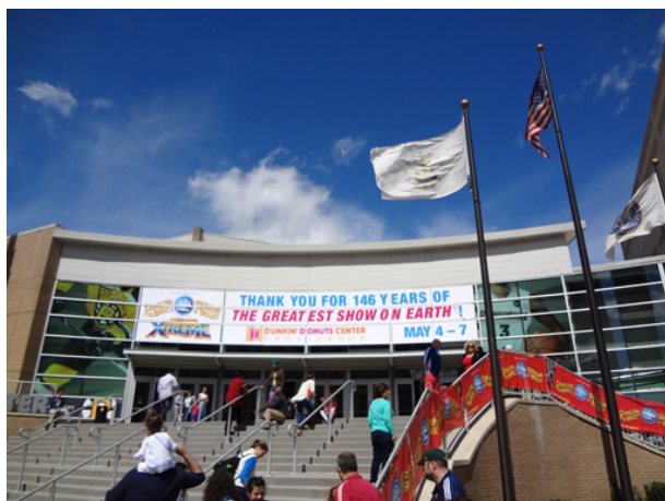
(il Dunkin' Donuts Center di Providence il 7 maggio scorso)

“Questa sera, alle 19.00, ora della East Coast, si celebrerà l'ultimo spettacolo di “Ringling Bros. and Barnum & Bailey Circus” – Blu Unit a Uniondale, New York.