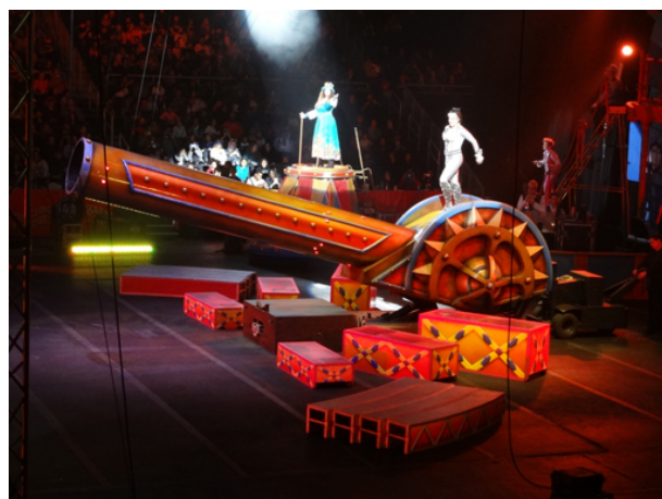
la donna proiettile