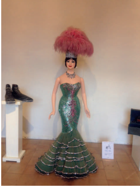
Un costume degli anni 60 di Moira Orfei in mostra a Lonato

Alle esibizioni, tra le quali anche una del Circo Paniko, si alternavano degli interventi dedicati alla Regina del Circo: Platinette, che è stata sua amica, ha raccontato ad esempio diversi aneddoti ironici su Moira, ma ne ha anche ricordato l'enorme importanza quale icona popolare italiana.