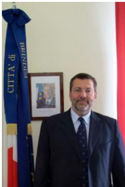
Il sindaco di Brindisi

Dopo Alessandria si squaglia al sole un'altra roccaforte animalista, quella di Brindisi. E' di oggi il decreto cautelare del Tar di Lecce che accoglie il ricorso del circo Darix presenta Orfei di Darix Martini (difeso dall'avvocato Cerceo), coadiuvato dall'Ente Nazionale Circhi. Il merito del ricorso sarà discusso a settembre, ma il Tribunale Amministrativo Regionale ha già frantumato il divieto all'uso degli animali. La nota del dirigente, dice in sintesi il Tar, impropriamente richiama l'ordinanza sindacale n. 27 del 25/10/2012, in quanto "riferibile a diversa fattispecie". "La nota dirigenziale determina una situazione caratterizzata da estrema gravità ed urgenza tale da giustificare la concessione dell'invocata misura cautelare provvisoria". Accolta quindi l'istanza del circo che adesso potrà lavorare, ovviamente con gli animali, nella città di Brindisi. Da segnalare che il sindaco di questa città non aveva tenuto in considerazione nemmeno una netta presa di posizione del prefetto di Brindisi, chiamato in causa dall'Ente Nazionale Circhi.