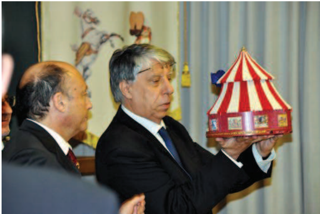
il Senatore Carlo Giovanardi