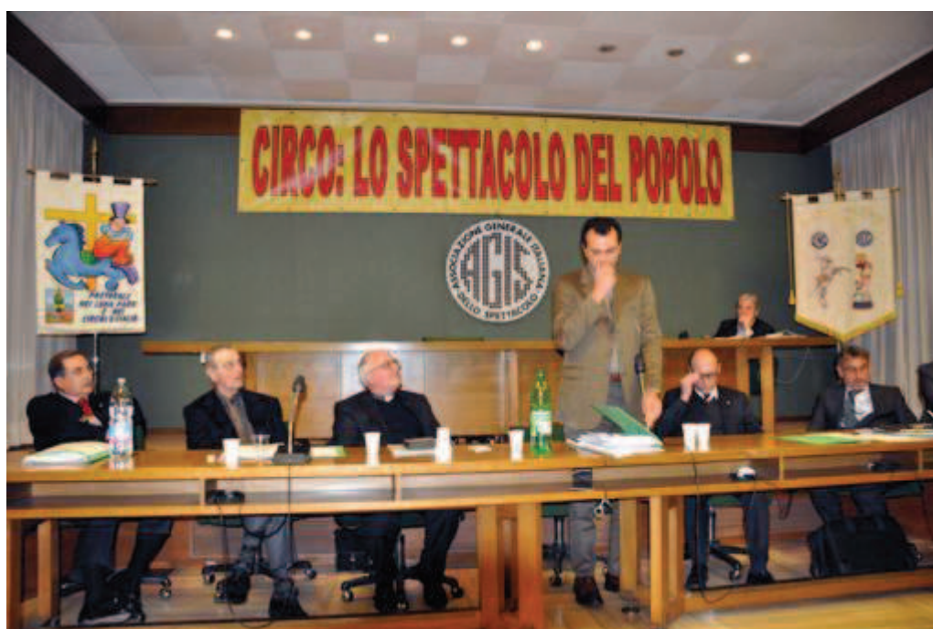
l'Onorevole Scurria (Parlamento Europeo)