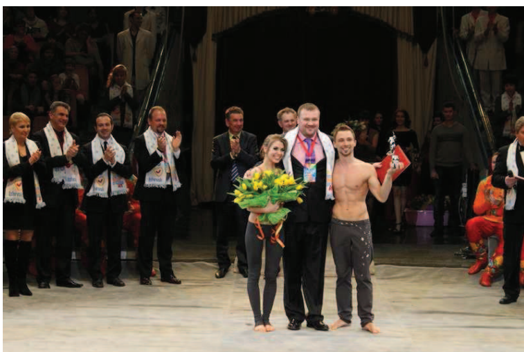
Duo Paradise, acrobazia