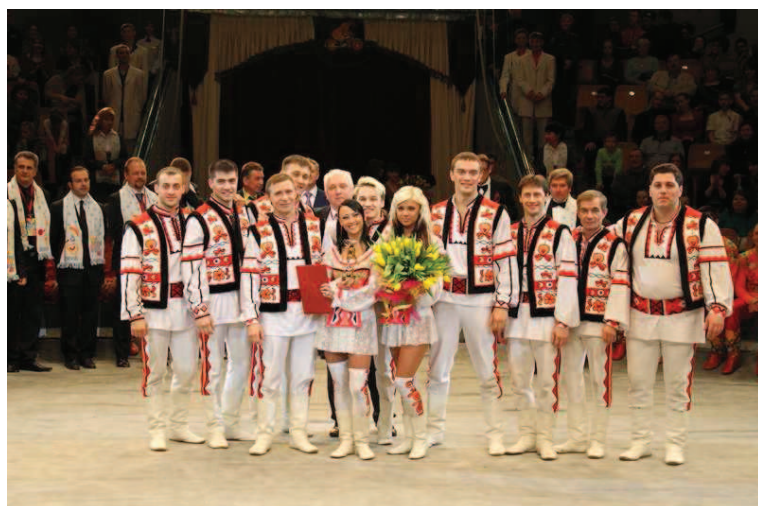
Acrobati alle bascule "Bukovina"