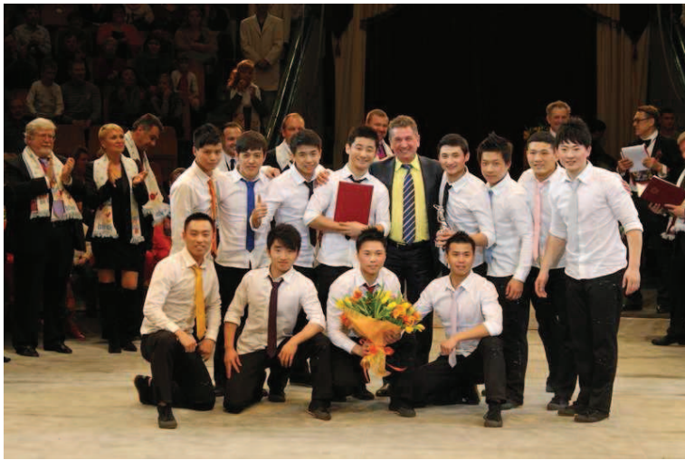
Jinan Acrobatic Troupe, salti nei cerchi