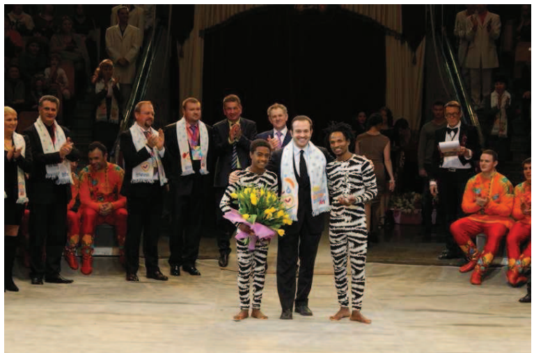
Cyka Brothers, icariani