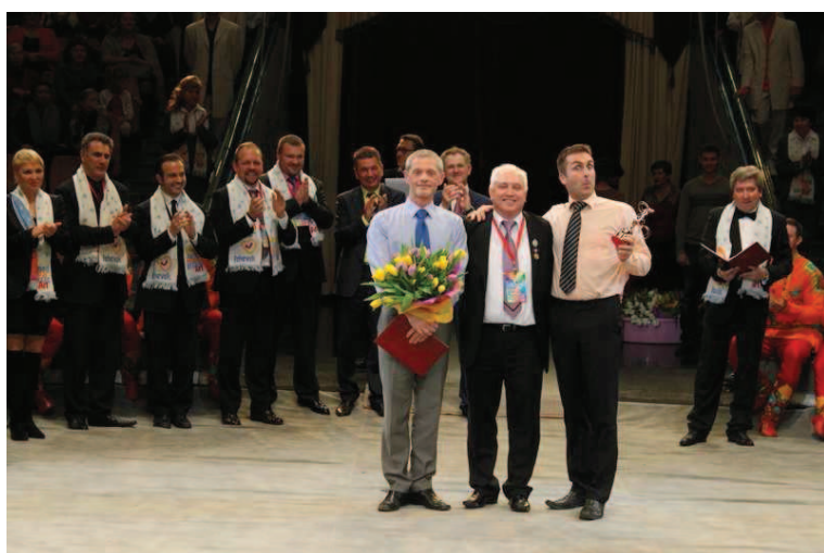
Strahlemann & Sohne, giocolieri