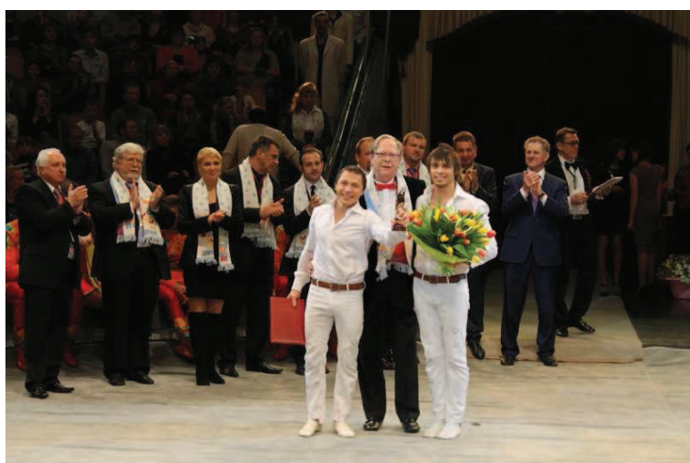
Duo "Just two men", strappate