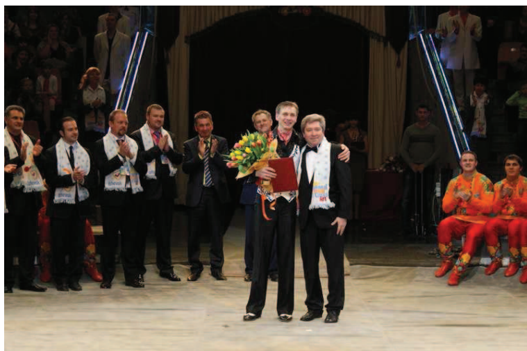
Attrazione "Lioness's Empire di Vitaly Smolyanets, leoni e tigri