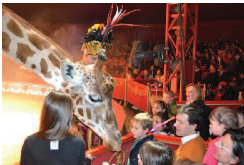
Foto e notizie dall'Ufficio Stampa del Circo Medrano