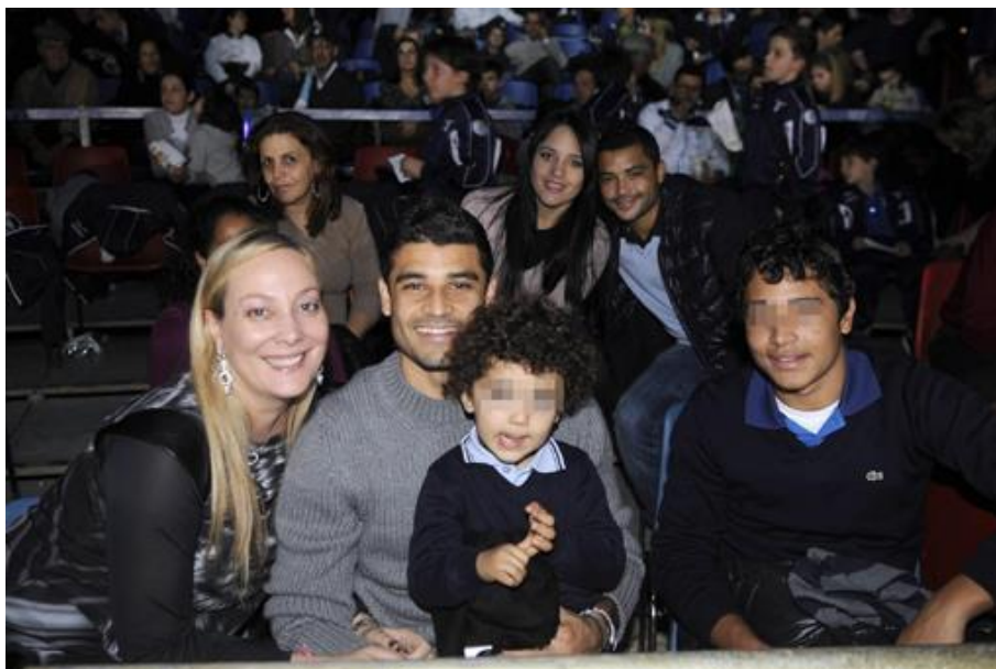
(Ederson Honorato Campos)

della S.S. Lazio, Claudio Lotito, durante il suo intervento allo spettacolo «It's Magic» che l'American Circus ha dedicato alla S.S.Lazio in occasione del compimento di 113 anni dalla sua fondazione.