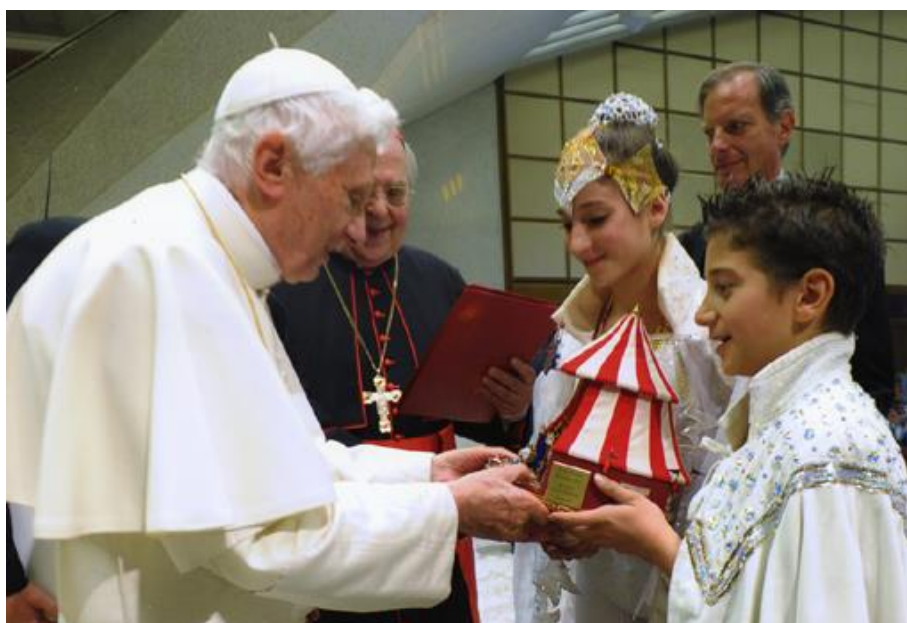
Angela e Maicol con Papa Benedetto XVI°