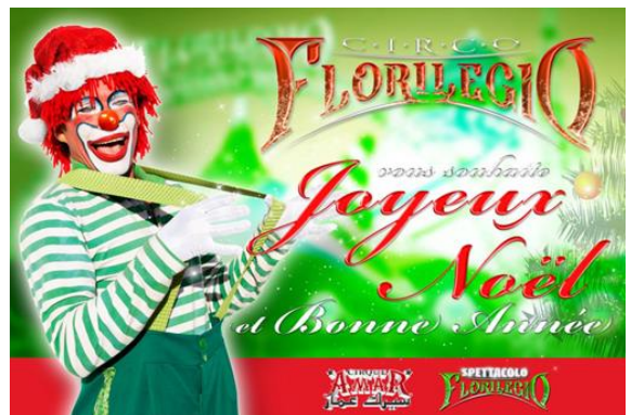
Gli Auguri del Florilegio