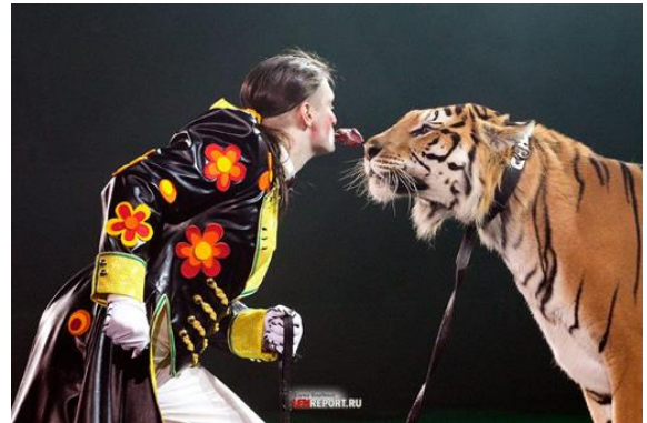
Una bellissima immagine dal nuovo spettacolo "K.U.K.L.A."