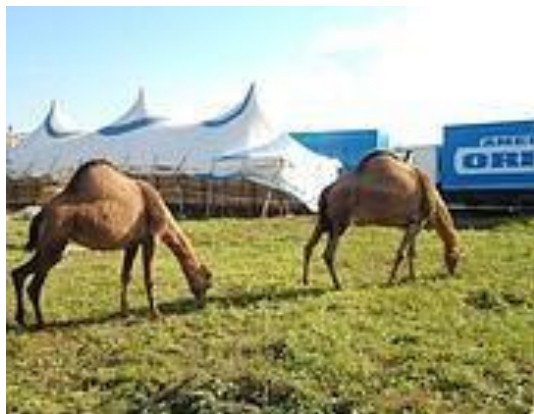
I dromedari del Circo Amedeo Orfei (foto vigili Ciampino)

ROMA - Animalisti in festa, bambini un po' tristi per l'esito dello scontro tra il Comune di Ciampino e il Circo Orfei sul divieto di utilizzare animali negli spettacoli. Il Tar del Lazio, sezione II bis, ha infatti respinto il ricorso presentato dal Circo «Amedeo Orfei di Lino Orfei» che aveva chiesto l'annullamento del Regolamento a tutela e rispetto degli animali del Comune ai piedi dei Castelli Romani. Il circo, che dal 16 novembre si era installato con i suoi tendoni bianchi alle porte della cittadina, in zona viale Kennedy, aveva dovuto sospendere gli spettacoli in programma dal 6 al 16 dicembre con elefante, zebre, coccodrilli, lama, pony e dromedari, in seguito ad una ispezione della locale polizia municipale. E per questo aveva chiesto un risarcimento danni per non aver potuto utilizzare gli «artisti» a quattro zampe. Ma il Tar ha deciso diversamente.