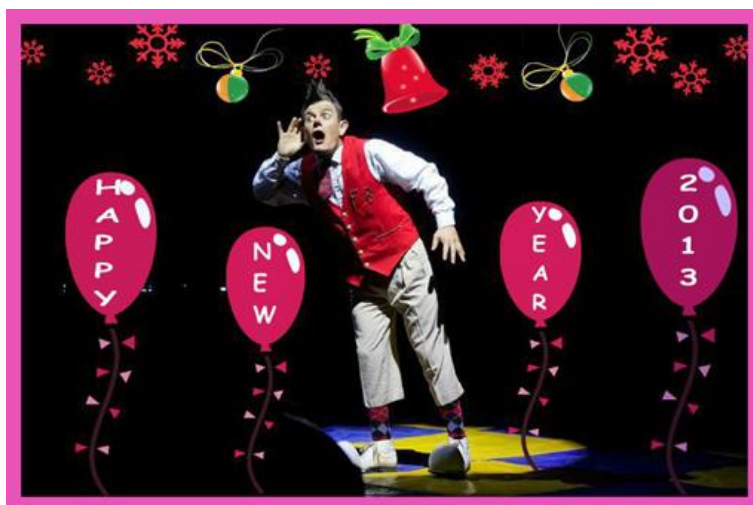
Auguri da Fiorino Bizarro

Con gli Auguri di Buon Anno di David Larible salutiamo tutti voi, cari Amici, e salutiamo e ringraziamo anche tutti gli altri che ci hanno inviato messaggi di auguri per queste feste 2012. E che l'anno che è arrivato sia migliore di quello che abbiamo salutato. Speriamo. Ne abbiamo bisogno proprio tutti!