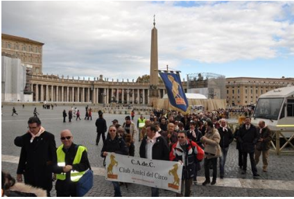
Sta per partire il corteo... 02.12.2012