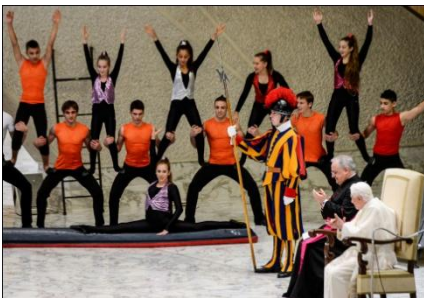
Foto Il circo in piazza San Pietro

UN TENDONE IN PIAZZA SAN PIETRO, IL PAPA: "IL CIRCO INSEGNA VALORI ALLA CHIESA E ALLA SOCIETÀ" L'APPELLO DI BENEDETTO XVI