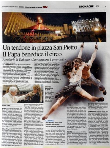
(da "La Nazione")