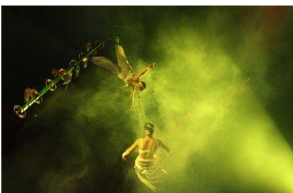
A silver-medal winning item.