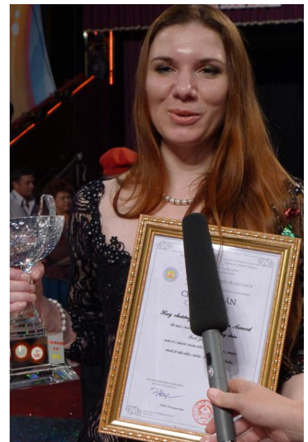
A Russian artist.

Un numero di artisti vietnamiti al Festival.