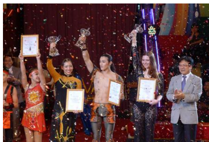
The gold medal winners.