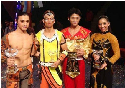
The silver medal winners.