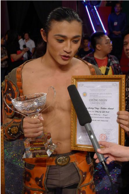
A Mongolian artist.