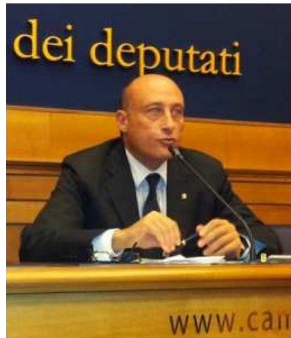
Il Presidente Buccioni

Vi segnaliamo questo articolo di www.circo.it in merito alla riunione che si terrà domani a Pantigliate (MI), al Circo Kodanty, dalle ore 11 alle ore 14. Intervenite numerosi!!!