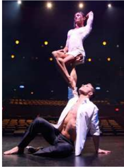
Duo MainTenant (Francia), mano a mano