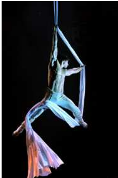
Thibault Bregere "Gladiatore" (Francia), tessuti