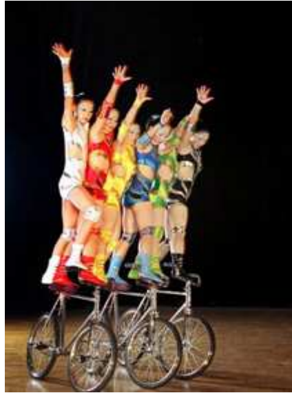
Troupe Dalian (Cina), biciclette