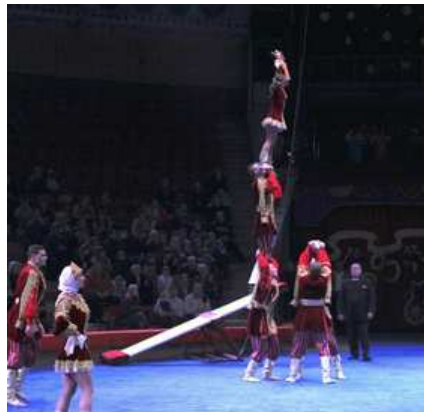
Troupe Kovgar (Russia), bascule