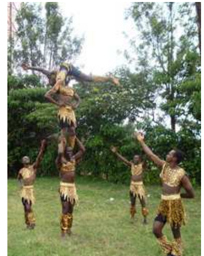
Troupe "Pamoja" (Kenia), acrobazie a terra