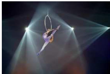
Oksana Pylypchuk "Lira" (Ucraina), cerchio aereo