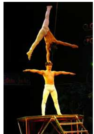
Giang Brothers (Vietnam), mano a mano