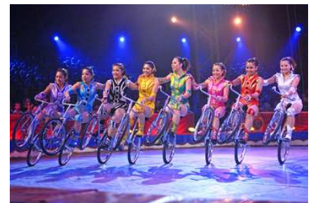
Dalian Girls (biciclette)