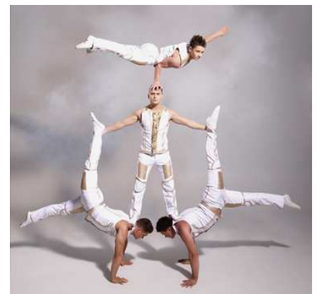
White Gold (equilibristi)