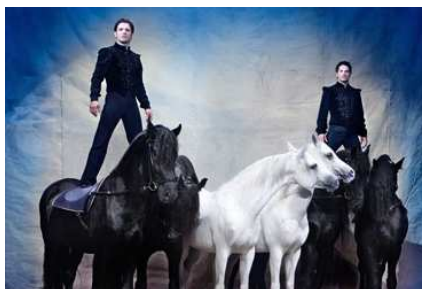
Fratelli Errani (posta ungherese)