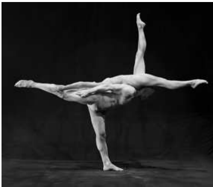
Duo La Vision (Canada), mano a mano