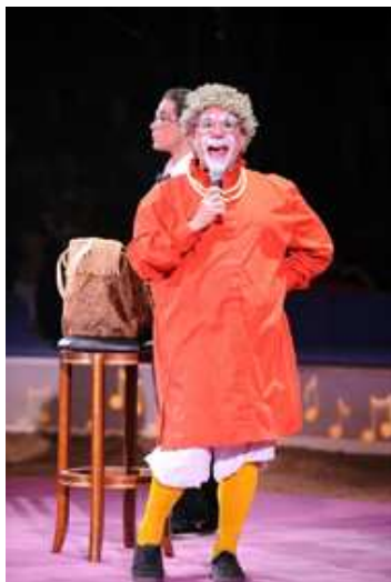
Barry Lubin - Granma (Stati Uniti), clown