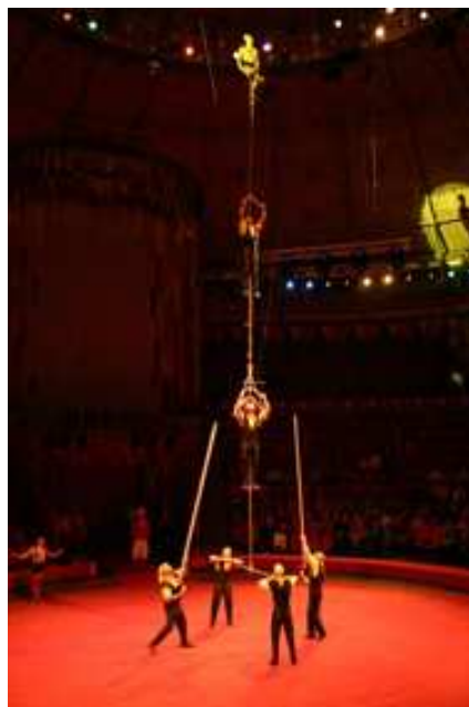
Troupe Aleksey Sarach (Russia), pertiche