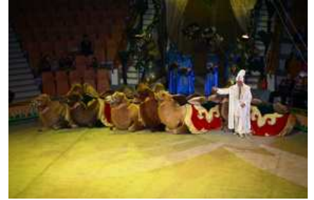
Tigran Akopian (Armenia), cammelli