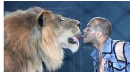
Hamada Kouta "Leoni e tigris dall'Egitto" (Egitto), leoni e tigris