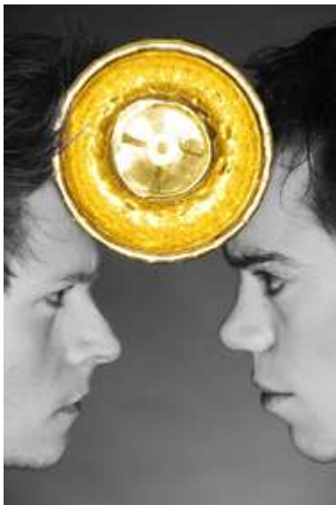
'Golden Time' (Germania), diabolo