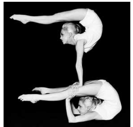
Duo Vilja (Svezia), contorsioniste