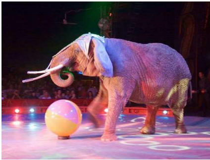
UN MOMENTO DELLO SPETTACOLO DEL CIRCO DI MOIRA ORFEI

Circo a Bergamo fino a settembre - La magia continua con Moira 25.08.2011