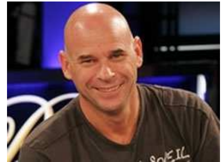
Guy Laliberté

Il fondatore del Cirque du Soleil , Guy Laliberté , organizzerà in collaborazione con World Series of Poker (WSOP) , il più importante torneo di poker al mondo, a favore della sua organizzazione ONE DROP .