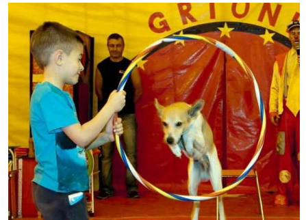
IGNAZIO, IL CANE ATTORE

Attualmente l'artista con il suo cane collabora con il «Circo Grioni», uno dei tendoni più piccoli d'Europa a conduzione familiare, che è stato fino a lunedì a Sant'Omobono e sarà a Dalmine dal 29 aprile al 1° maggio e dal 6 all'8 maggio compresi.