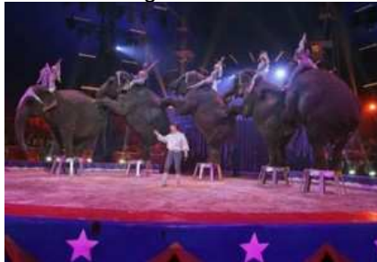
Flavio Togni, Clown d'Oro al festival di Monte Carlo

presenza di diversi membri del "Club Amici del Circo" e componenti di importanti famiglie italiane del settore ha reso la giornata davvero speciale. Quest'anno, in occasione del secondo appuntamento col World Circus Day bisognerà dimostrare di saper fare ancora meglio, con più imprese circensi coinvolte nell'evento e in grado di attirare l'attenzione dei media e delle amministrazioni locali mostrando il volto più accattivante del nostro universo. L'Accademia diretta dall'infaticabile Grand'Ufficiale Egidio Palmiri, da par suo, sta facendo le cose in grande: migliaia di volantini sono stati distribuiti in tutte le scuole della città e del circondario invitando gli studenti e le loro famiglie ad essere protagonisti dell'evento che vedrà la partecipazione sia degli allievi interni che degli amatori.