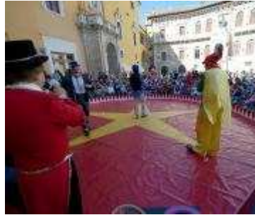
Il circo in piazza del Popolo

Takimiri incanta tantissimi bambini e anche i genitori. Domenica in centro eventi per tutta la giornata Fermo, 11 aprile 2011 - UNA DOMENICA colorata, una domenica di festa vera, con l'aria quasi estiva e la voglia di uscire e di divertirsi che c'è.