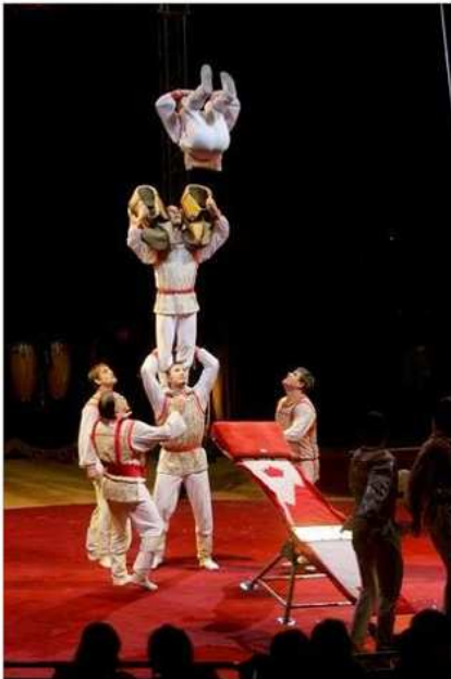
Los números de The Puzanov fueron espectaculares. ARTURO PÉREZ

I russi Puzanovi hanno conquistato il primo premio del IV° Festival Internazionale del Circo di Albacete. Il gruppo, considerato una delle migliori troupes di bascula della storia del circo, ha sorpreso col doppio salto mortale con doppio piroetta su un trampolo e col più difficile ancora: il triplo salto mortale con triplo piroetta e quintuplo salto mortale.