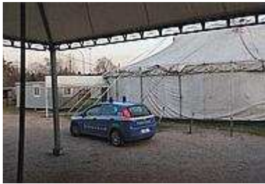
La polizia all'accademia d'arte circense

LEI È GRAVE. IL MOVENTE: AVEVA PAURA DI PERDERE LA FAMIGLIA. ENTRAMBI DIPENDENTI DELLA SCUOLA. LA DONNA È STATA COLPITA PIÙ VOLTE ALL'ADDOME. ARRESTATO