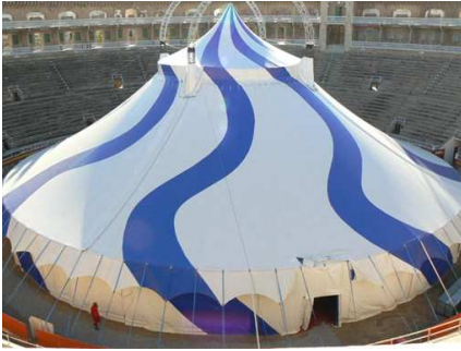
(il bellissimo nuovo chapiteau)

Il pubblico quindi ha la possibilità di godersi lo spettacolo ad una temperatura piacevole senza soffrire il caldo esterno che in questo mese è arrivato ad alte temperature. In tutta la pubblicità, manifesti, giornali, radio e tv viene evidenziato che il circo ha l'impianto di climatizzazione assicurando così le famiglie stesse. Intanto dal prossimo mese di Luglio in occasione della piazza di Valencia verrà installato il nuovo chapiteau (Nella foto a Barcellona) di nuova costruzione, tondo, bianco con onde blu, completamente nuovo anche nel suo allestimento interno con poltrone chiudibili (tipo cinema) in tutti i settori, che renderà lo spettacolo ancora più grandioso e darà al pubblico ancora più comodità. La tribuna circolare arriva fino al bordo della piscina palcoscenico.