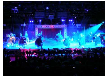
(il Circo Americano al palasport di Livorno)

Vi ritornò 15 anni dopo, nel 1998, con gli elefanti e il bellissimo numero di 16 cavalli in libertà che gli fruttò il terzo argento.