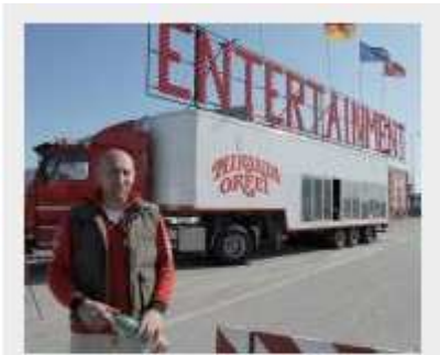
Uno dei camion del Circo Orfei a Forlì

Forlì, 8 aprile 2010 - Disavventura per il Circo Orfei (programmati spettacoli dal 9 al 19 aprile) ieri in via Montaspro, al Ronco, dove doveva montare le tende. Arrivato il camion con l'elefantessa («L'elefante più grande d'Europa!» come si legge nel volantino pubblicitario), il terreno — fangoso — ha ceduto facendo sprofondare l'autoarticolato.