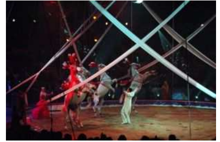
Sanremo: 'diversamente' circo, Comune e Asl per disabili 02.03.2010