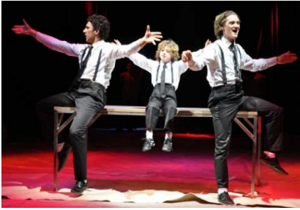
Cuneo: circo equestre per 7 giorni nell'ex Foro Boario 01.03.2010