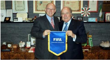
Rolf Knie con Joseph Blatter