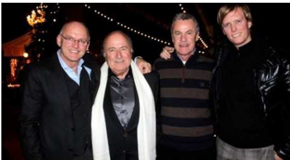
Rolf Knie, Joseph Blatter, l'allenatore della nazionale di calcio svizzera Ottmar Hitzfeld