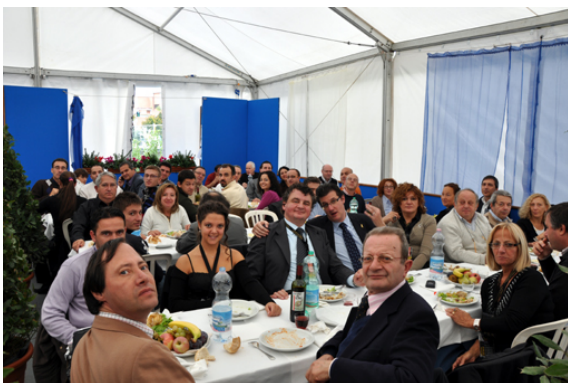
gli Amici a pranzo