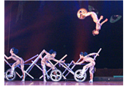
Wolf Hunan Truppe