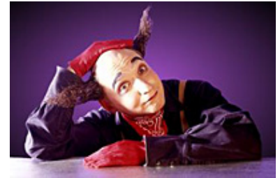
Housch Ma Housch

Come sempre un programma eccellente quello che sarà proposto a Stoccarda dall'11 Dicembre prossimo e fino al 10 Gennaio al WELTWEIHNACHTSCIRCUS STUTTGART 2009 – 2010