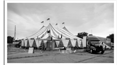
Circo Osorio, el coloso de las Americas

Un bel servizio fotografico in bianco e nero sul Circo Osorio , dagli Stati Uniti