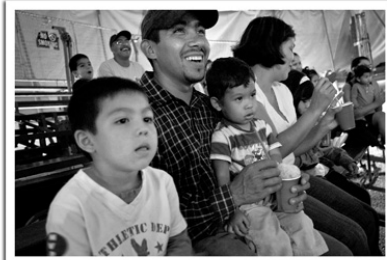
A Wichita family