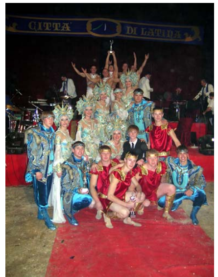
Un bel gruppo di artisti ucraini, russi e bielorusi